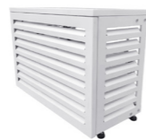
AC BOX G (antracytowy)